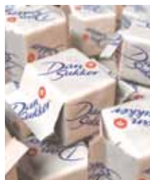
Sukker 2 stk's å 7 g, Karton Art nr: 42226 Antal pakn/salgskolli: 1070 st