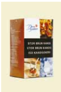
Stor Brun Kandis 500 g Art nr: 47205