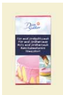
Flor Jordbær 300g Art nr: 43717

Flor med smag anvendes til glasur og som smagstilsætning i tærte- og kagefyld samt til at drysse over desserter og bagværk.