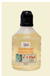
Glukosesirup, 400g Art nr: 46452

Antal pakn/salgskolli: 8 x 400 g Fyldig smag, lidt som lakrids. Produceret på Fairtrade certificeret kvalitetsråsukker. God som smagtilsætning, i marinader og som topping.