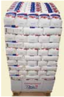
Sukker 2 kg 1/2-palle Art nr: 41108