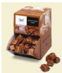
Rørsukker Fairtrade 2 stk's å 6,6 g, Displaybox Art nr: 42229 Antal pakn/salgskolli: 160 st