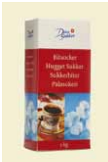
Hugget Sukker 1 kg Art nr: 42209

Hugget Sukker, også kendt som styksukker eller sukkerknalder, findes i forskellige størrelser og hårdhed. Styksukker laves ved at tilsætte damp til sukker, hvorefter det fugtige sukker bliver formet.