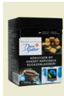
Hugget Rørsukker, Fairtrade 500 g Art nr: 42512

Kandissukker produceres af roesukker. De store lysebrune krystaller fremstilles gennem langsom krystallisering. Kandissukker har en mild, naturlig aroma.