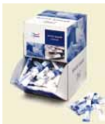
Sukker 5 g Sticks, Displaybox Art nr: 41404 Antal pakn/salgskolli: 200 st