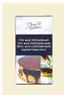
Flor Chokolade 300g Art nr: 43718