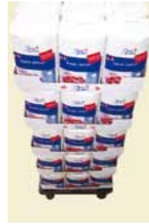
Sukker 2 kg 1/4-palle Art nr: 41113