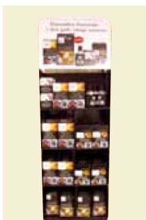
Rørsukkerdisplay Fairtrade 1/4 palle Art nr: 42119

Indhold: 25 pk. Brun Farin 500 g 20 pk. Flormelis 500 g 10 pk. Perlesukker 500 g 8 pk. Rørsukker 500 g 6 pk. Dansk Sukker 2 kg