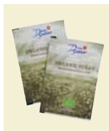
Økologisk Sukker, portionsposer å 6g, Karton Art nr: 41656 Antal pakn/salgskolli: 845 st