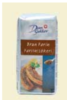
Brun Farin 500g Art nr: 45206

Brun Farin er en blanding af sukker og rørsukkersirup. Mange kender det som drys på ymer og kager, men det er også meget velegnet til madlavning, da det giver en særlig, lidt karamellignende smag, som er fortrinlig i mange forskellige madretter.