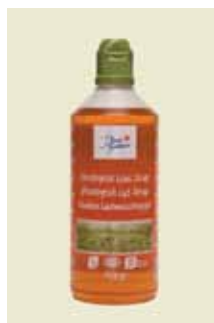
Økologisk Sirup 750g Art nr: 46439

Antal pakn/salgskolli: 8 x 750 g Mørk Sirup er en blanding af rør- og roesukkersirup. Alt efter blandingsforholdet får siruppen forskellig smag og farve. Den mørke sirup har en kraftigere smag end den lyse sirup. Den passer til såvel brunkager og chokoladekaramel som brune bønner, koldolmere og andre madretter.