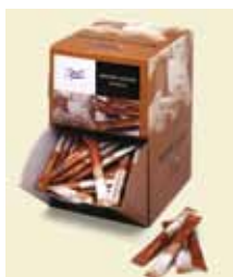
Rørsukker Fairtrade, 5 g Sticks, Displaybox Art nr: 41608 Antal pakn/salgskolli: 200 st