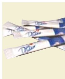
Sukker 5 g Sticks, Karton Art nr: 41402 Antal pakn/salgskolli: 1000 st