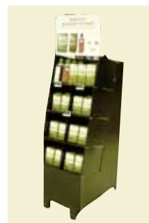
Økologisk Display 1/4 palle Art nr: 42120

Indhold: 10 pk. Vaniljerørsukker Fairtrade 170 g 18 pk. Hugget Rørsukker Fairtrade 500 g 30 pk. Rørsukker Strø Fairtrade 500 g 12 fl. Cane Syrup Fairtrade 400 g