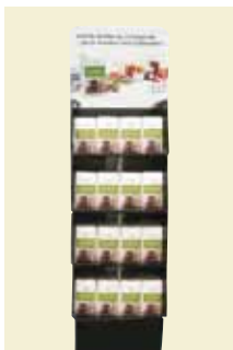
Syltedisplay 1/4 palle Art nr: 42117

Antal pakn/salgskolli: 270 x 500 g på 1/4 palle