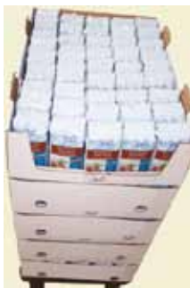
Brun Farin 500 g 1/4 palle Art nr: 45207

Antal pakn/salgskolli: 225 x 500 g på 1/4 palle.