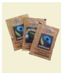
Rørsukker Fairtrade, portionsposer å 6 g, Karton Art nr: 41627 Antal pakn/salgskolli: 845 st