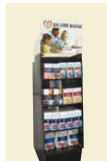
Bagedisplay 1/4 palle Art nr: 42116

Indhold: 25 pk. Brun Farin 500 g 20 pk. Flormelis 500 g 10 pk. Perlesukker 500 g 8 pk. Rørsukker 500 g 6 pk. Dansk Sukker 2 kg