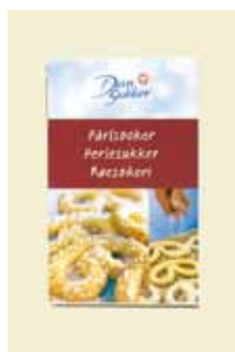
Perlesukker 500g Art nr: 44202

Antal pakn/salgskolli: 14 × 500g Perlesukker er store sukkerkrystaller, som har kogt længere tid end almindeligt sukker, så sukkerkrystallerne derved er blevet større. Perlesukker bruges blandt andet til at lave bolsjer, kandiserede æbler og som pynt på småkager.