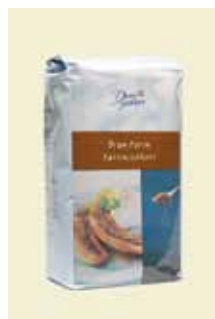
Brun Farin 2 kg Art nr: 45205

Antal pakn/salgskolli: 4 × 2 kg Brun Farin pakket i 2 kg's folieposer til Foodservice.