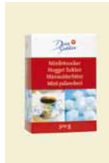
Hugget Sukker 500 g Art nr: 42212