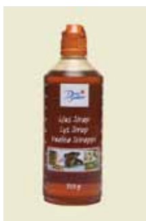
Lys Sirup 750g Art nr: 46445

Hvad er sirup? Sirup laves af rå sukker fra sukkerroer eller sukkerrør. I Dansukkers sortiment er der sirup med et varierende indhold af sukkerroens og sukkerrørets naturlige smag og farvekomponenter, der bestemmer farve og smag. Der er således forskellige varianter af sirup, hver med sin specielle smag og farve. Sirup indeholder forskellige sukkerarter, nemlig almindeligt sukker, druesukker og frugtsukker. Ud over at give en sød smag har sirup en del funktionelle fordele: Sirup fremmer gæringen i brød, giver en fin skorpe, holder brødet saftigt og friskt længere og er desuden en udmærket smags giver og smagsforstærker i forskellige madretter.