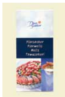
Flormelis 500g Art nr: 43200

Antal pakn/salgskolli: 14 × 500g Perlesukker er store sukkerkrystaller, som har kogt længere tid end almindeligt sukker, så sukkerkrystallerne derved er blevet større. Perlesukker bruges blandt andet til at lave bolsjer, kandiserede æbler og som pynt på småkager.