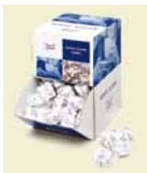
Kuvert Sukker 2 stk's å 4,6 g, Displaybox Art nr: 42237 Antal pakn/salgskolli: 300 st