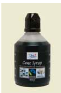
Cane Syrup 400g Art nr: 46438

Antal pakn/salgskolli: 8 x 750 g Økologisk sirup er baseret på økologisk dyrket sukker. Økologisk sukker er dyrket uden brug af kemiske bekæmpelsesmidler og kunstgødning. Jorden får sin næring fra naturlige gødningsstoffer. Bekæmpelsen af ukrudt på markerne foregår manuelt. Økologisk Lys Sirup har en fin lys farve med en karamelagtig smag og passer til slik, småkager, desserter, saucer, kødretter m.v.