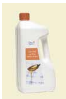
Lys Sirup 2,8 kg Art nr: 46430

Antal pakn/salgskolli: 8 x 750 g Lys Sirup er en blanding af rør- og roesukkersirup. Alt efter blandingsforholdet får siruppen forskellig smag og farve. Lys Sirup har en fin lys farve med en karamelagtig smag og passer til slik, småkager, desserter, saucer, kødretter m.v.