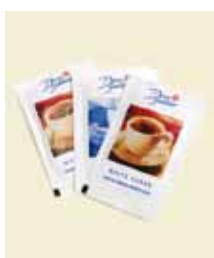
Sukker, portionsposer å 6 g, Karton Art nr: 41401 Antal pakn/salgskolli: 845 st