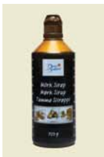
Mørk Sirup 750g Art nr: 46442

Antal pakn/salgskolli: 4 x 2,8 kg Den klassiske lyse sirup i en praktisk 2-liters-dunk med håndtag og målerude. Foodservice pakning.