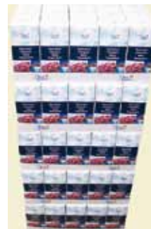
Flormelis 500 g 1/4 palle Art nr: 43201

Antal pakn/salgskolli: 225 x 500 g på 1/4 palle.