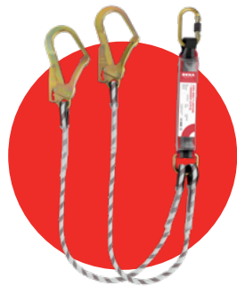
JURA 4062 Câble en Y XL avec amortisseur 1,5 m Art. n°. 8.84.062.00