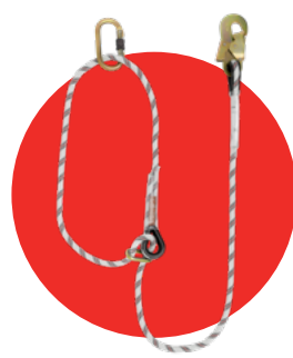
HELENA 4084 Ligne de positionnement réglable 2 m Art. n°. 8.84.084.00