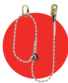
HELENA 4084 Positionierleine verstellbar 2m Art. nr. 8.84.084.00