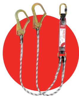
JURA 4062 Y-Kabelbinder XL mit Stoßdämpfer 1,5 m Art. nr. 8.84.062.00