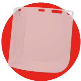
COLO 8550 Art. nr. 7.78.550.00