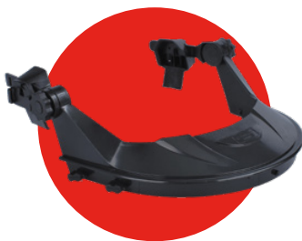
COLIMA 8510 Art. nr. 7.78.510.00