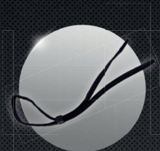
VISION 8900 BRILLENKORDEL Art.-Nr. 7.78.900.00