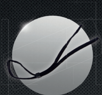
VISION 8900 BRILLENKORDEL Art.-Nr. 7.78.900.00