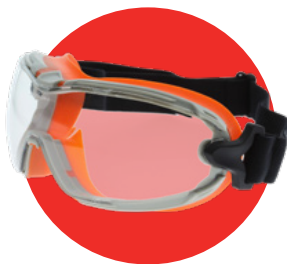
X-VIEW-COMFORT 8240 Art. n° 7.78.240.00