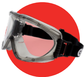
EGON 8226 Art. n° 7.78.225.00