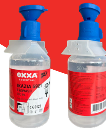
Afgebeeld: met wandhouder (art.no. 7.25.926.00)