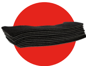
KIGALI 8205 Art. n° 6.78.205.00