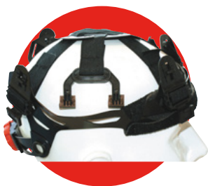
OTTOWA 8220 Art. n° 6.78.220.00