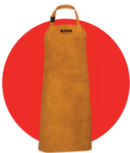
MARTY 0101 Art.-Nr. 2.70.101.00