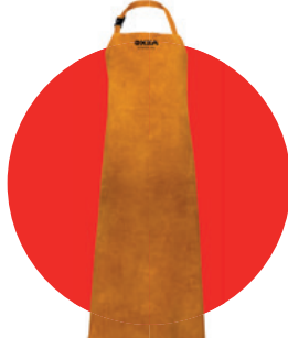
MARY 0141 Art.-Nr. 2.70.141.00