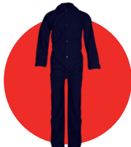
WARONA 5400 Art. nr. 2.45.400.00