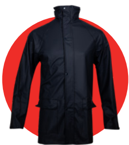
WALAKA 5200 Art. nr. 2.45.200.00