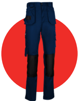
EDUARD 7260 Art. n° 2.27.260.00