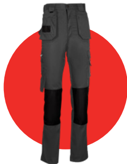
EDUARD 7260 Art. n° 2.27.263.00