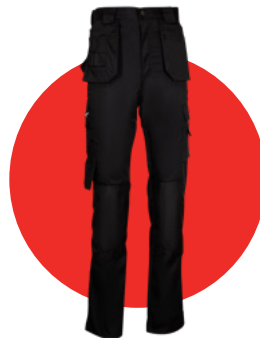
EDUARD 7260 Art. n° 2.27.265.00