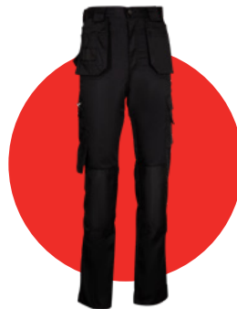
EDUARD 7260 Art.-Nr. 2.27.265.00