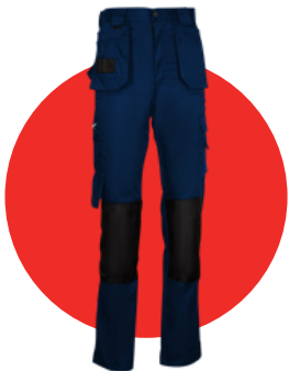
EDUARD 7260 Art.-Nr. 2.27.260.00