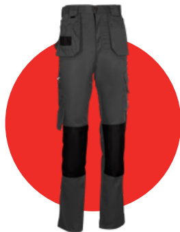
EDUARD 7260 Art.-Nr. 2.27.263.00